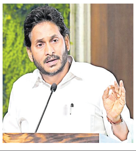
అమరావతి (14.07.23 మీడియా సెల్)

ఆంధ్రప్రదేశ్ విద్యా విధానం లో ఆర్థిపిషియల్ ఇంటిలిజెన్స్ (ఏఐ)ను ప్రవేశ పెట్టడం ద్వారా విద్యార్థులకు అత్యుత్తమ బోధన, నేర్చుకునే సామర్థ్యం పెంచడంతో పాటు.. వారిని ఏట క్రియేటర్లుగా తీర్చిదిద్దేలా పాఠ్య ప్రణాళికలు రూపొందించాలని ముఖ్య మంత్రి వైఎస్ జగన్మోహన్ రెడ్డి వర్చువల్ వీసీ లకు పిలుపునిచ్చారు. పాఠశాల స్థాయి నుంచి ఉన్నత విద్య వరకు కరిక్యులమ్ ఏట ఒక భాగం కావాలని స్పష్టం చేశారు. భవిష్యత్తు విద్యా విధానాన్ని ఏట మార్చబోతోందని, ఈ రూపంలో ప్రపంచం నాలుగో పారిశ్రామిక విప్లవం దిశగా అడుగులు వేస్తోందని చెప్పారు. బోధన, నైపుణ్యాభివృద్ధిలో తొలిసారిగా ఎమర్జింగ్ టెక్నాలజీ అనుసంధానం చేసేలా వేగవంతంగా చర్యలు తీసుకోవాలని ఆదేశించారు. విద్యా శాఖ అధికారులు, విశ్వవిద్యాలయాల వైస్ చాన్సలర్లతో గురువారం ఆయన తన క్యాంపు కార్యాలయంలో కీలక సమావేశం నిర్వహించారు. ఈ సందర్భంగా మాట్లాడుతూ.. విద్యార్థుల్లో ప్రాక్టికల్ అప్లికేషన్లతో ఆఫ్ నాలెడ్జ్ తీసుకురావడంతో పాటు మరిన్ని వర్తికల్స్ చదువు కునే అవకాశం ఇవ్వాలన్నారు. సాంకేతిక వైద్య విధానాలు అందుబాటులోకి రావడంతో వైద్య విద్య పాఠ్య ప్రణాళిక, బోధనలో రోబోటిక్స్, ఏఐల ప్రాధాన్యం పెంచాలని చెప్పారు. నాలుగవ పారిశ్రామిక విప్లవంలో ఏపీ విద్యార్థులను గ్లోబల్ లీడర్లుగా తయారు చేయడమే లక్ష్యంగా అడుగులు ముందుకు వేయాలని దిశా నిర్దేశం చేశారు. ఆ వివరాలు సీఎం జగన్ మాట్లాడేసే..