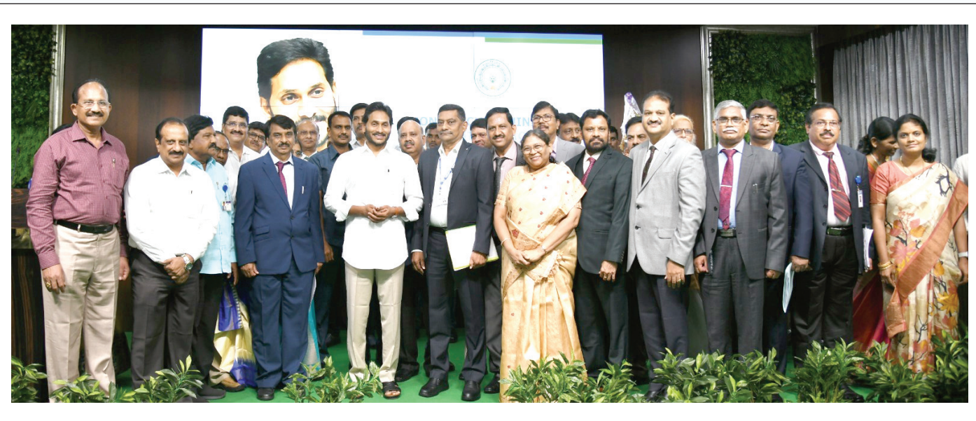
అవసరమైతే ఇంటర్మీడియట్ కంటెంట్ ద్వారా టెక్నాలజీ వాడకంపై శిక్షణ ఇస్తే మనకు తగినంత ఫ్యాకల్టీ సిద్ధమవుతారు.

అవకాశాలు ఇవ్వాలి. తాజాగా డిగ్రీలకు సంబంధించి క్రెడిట్స్ ఇస్తున్నాం. ఇకపై వాటి స్థాయిని పెంచుతూ ప్రతి ఫ్యాకల్టీలో ఎక్కువ ఆప్షన్లలో బోధన సాగించాలి. ఇప్పటికే ఇంటర్మీడియట్ తప్పనిసరి చేసి, ఉద్యోగ కల్పన దిశగా అడుగులేశాం. విద్యార్థుల ఉన్నతికి ఇలాంటి ఎన్నో మార్పులు అవసరం. మెడికల్ కోర్సుల్లో సాంకేతిక విజ్ఞానం పెంపు వైద్య విద్య కోర్సుల్లోని బోధన పద్ధతుల్లో గణనీయమైన మార్పులు రావాలి. భవిష్యత్తులో ఐదేళ్ల మెడికల్ కోర్సులో సాంకేతిక పరిజ్ఞానాన్ని పెంచాలి. శరీర భాగాలను కోసి ఆపరేషన్ చేసే రోజులు మారిపోయాయి. కంప్యూటర్ల ద్వారా ఏఐను వాడకుని చిన్న చిన్న రంధ్రాలతో ఆప రేషన్ చేస్తున్నారు. అందుకే వైద్య విద్యలో రోబో టిక్స్, ఏఐలను భాగస్వామ్యం చేయాలి.